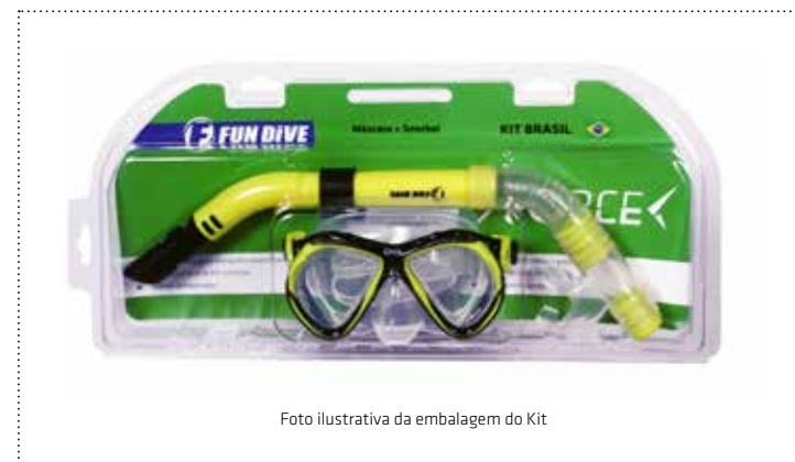
Foto ilustrativa da embalagem do Kit

Máscara em silicone e vidros temperados, com tira de ajuste fácil e lente única. Snorkel com válvula, top quebra onda e presilha de engate rápido.