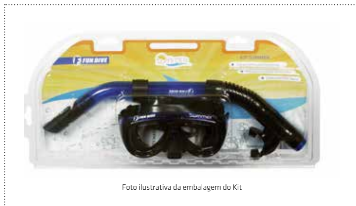
Foto ilustrativa da embalagem do Kit

Máscara em polivinílico e vidros temperados e baixo volume. Snorkel com válvula, top quebra onda e presilha de engate rápido.