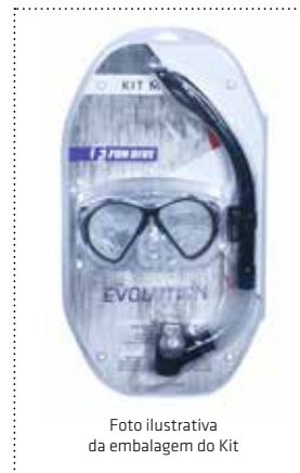
Foto ilustrativa da embalagem do Kit

Máscara em silicone Silsoft, vidros temperados e tiras de ajuste fácil. Snorkel com válvula, top quebra onda, bocal intercambiável em silicone e presilha de engate rápido.