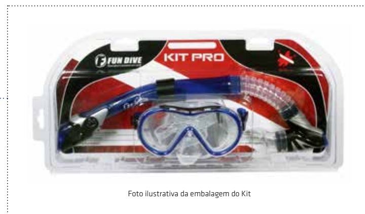
Foto ilustrativa da embalagem do Kit

Máscara em silicone, vidros temperados e lente única. Snorkel com dupla válvula, bocal intercambiável em silicone e presilha de engate rápido.