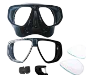
PEÇAS DE REPOSIÇÃO

Protetor de neoprene para tira de máscara