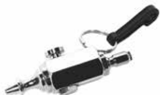
AIR - 01