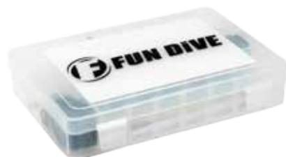
BOX - 16

Caixa com 16 tamanhos de O'ring e 2 removedores.