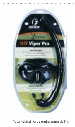
Foto ilustrativa da embalagem do Kit

Máscara em silicone, vidros temperados e lente única. Snorkel com válvula, top quebra onda, bocal intercambiável em silicone e presilha de engate rápido.